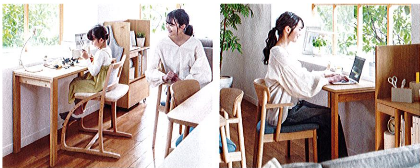
子どもが工作やお絵かきをたのしんだり...

リビングダイニングに家族で共有できるデスクコーナーを。家族のモノを収納できるマルチワゴンと、お子様にちょうどいいデスクチェアをプラスして、家族が同じ空間で過ごしなが、それぞれの作業に集中できるみんなにちょうどいいシェアデスクの完成です。