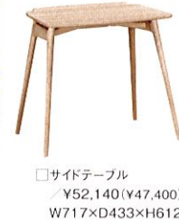
□サイドテーブル / ¥52,140 (¥47,400) W717×D433×H612

家族と一緒に料理をする機会も多くなった今、食品ストックや調理家電の収納場所に困っている…。誰もが使いやすいキッチン収納をご提案します。