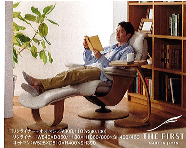
□リクライナー+オットマン / ¥308,110 (¥280,100) リクライナー: W840×D850/1180×H1060/800×SH400/460 オットマン: W525×D510×H400×SH390