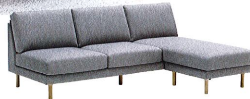
□射無シェーズロングセット / ¥327,800 (¥298,000) W2100×D1600×H810×SH430

ゆったり足を伸ばしたり、寝そべて映画を観たり、お昼寝したり。家族が思い思いのスタイルでくつろげる、シェーズロング・ソファ。サイドテーブルをプラスすると、映画や読書もお茶を飲みながら楽しんだり、読みかけの本や雑誌も置いて快適です。