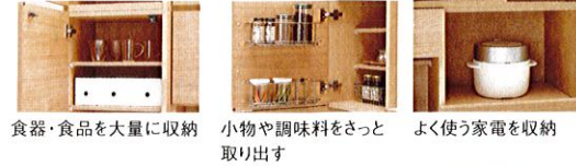
食器・食品を大量に収納 小物や調味料をさっと取り出す よく使う家電を収納