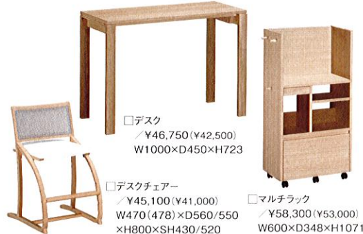
家事や趣味をするスペースにも